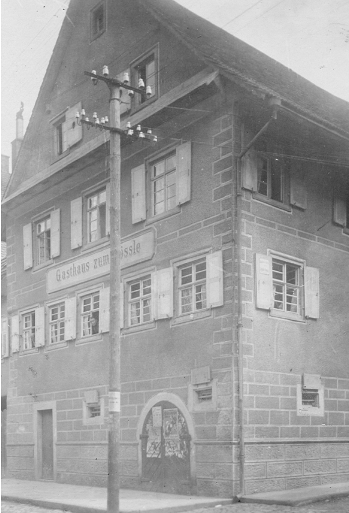
Gasthaus zum Rössle um 1920 (Gastwirtschaft von 1747 – 1952)

Das Gebäude wurde 1954 abgerissen und an gleicher Stelle der Neu- und Umbau der damaligen Bezirkssparkasse Oppenau errichtet.