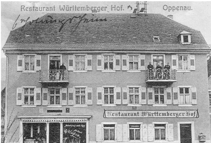
ehemaliges Gasthaus Württemberger Hof um 1900

Das Gasthaus „Württemberg Hof“ existierte von 1875 bis 1914. Seit 1914 ist das Anwesen im Besitz der Familie Klett.