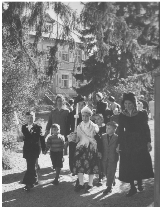
Personengruppe vor dem katholischen Pfarramt Oppenau am Weißen Sonntag im Jahre 1958