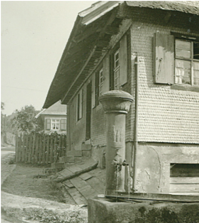
Brunnen auf der Ansetze um 1940