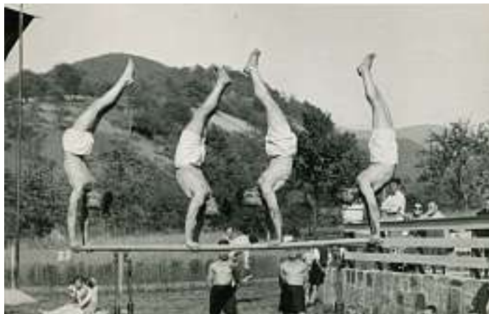
Turnübungen im städtischen Schwimm- und Sonnenbad um 1935