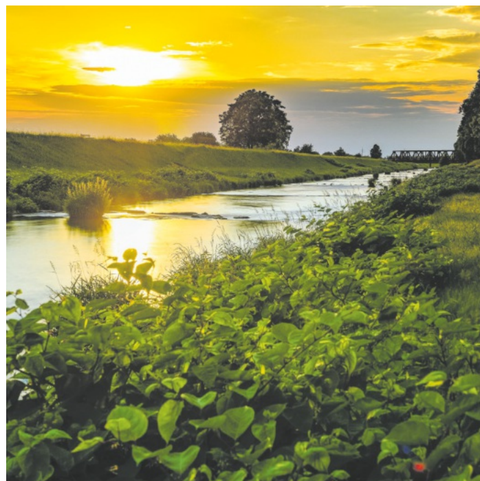
Renchtäler Sommerwochen