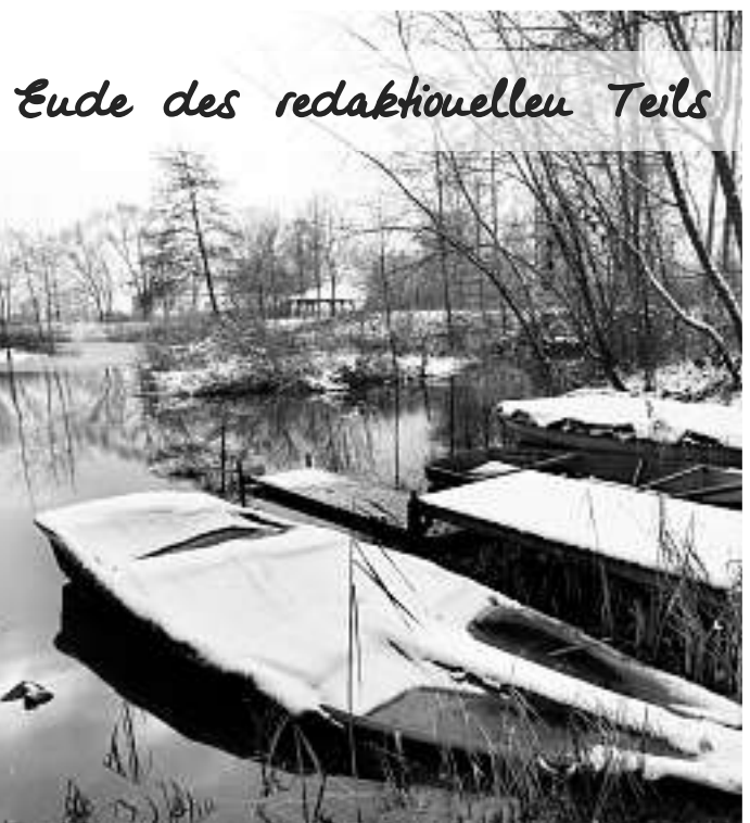
Eude des redaktionellen Teils

Apotheke Haaß Schillerplatz, Zeller Str. 31, 77654 Offenburg (Oststadt)