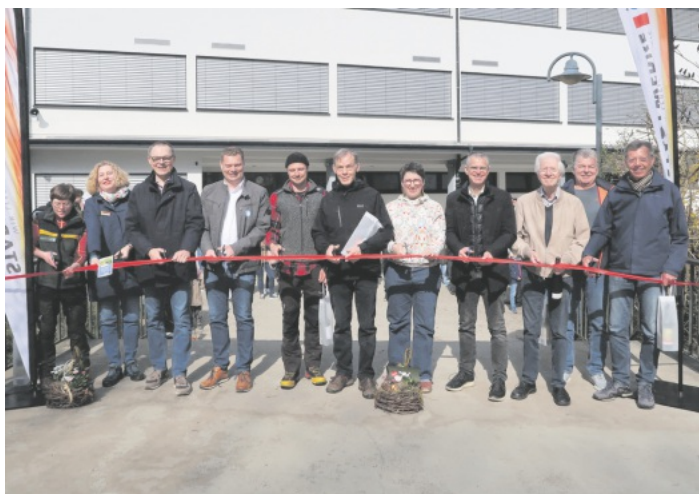
Eröffnung des neuen Erlebnispfades Flori Forelle in Oberkirch-Ödsbach

Weitere Informationen sowie die digitale Route des Erlebnispfades und der neue Flyer inklusive Streckenbeschreibung sind unter www.renchtal-tourismus.de verfügbar.